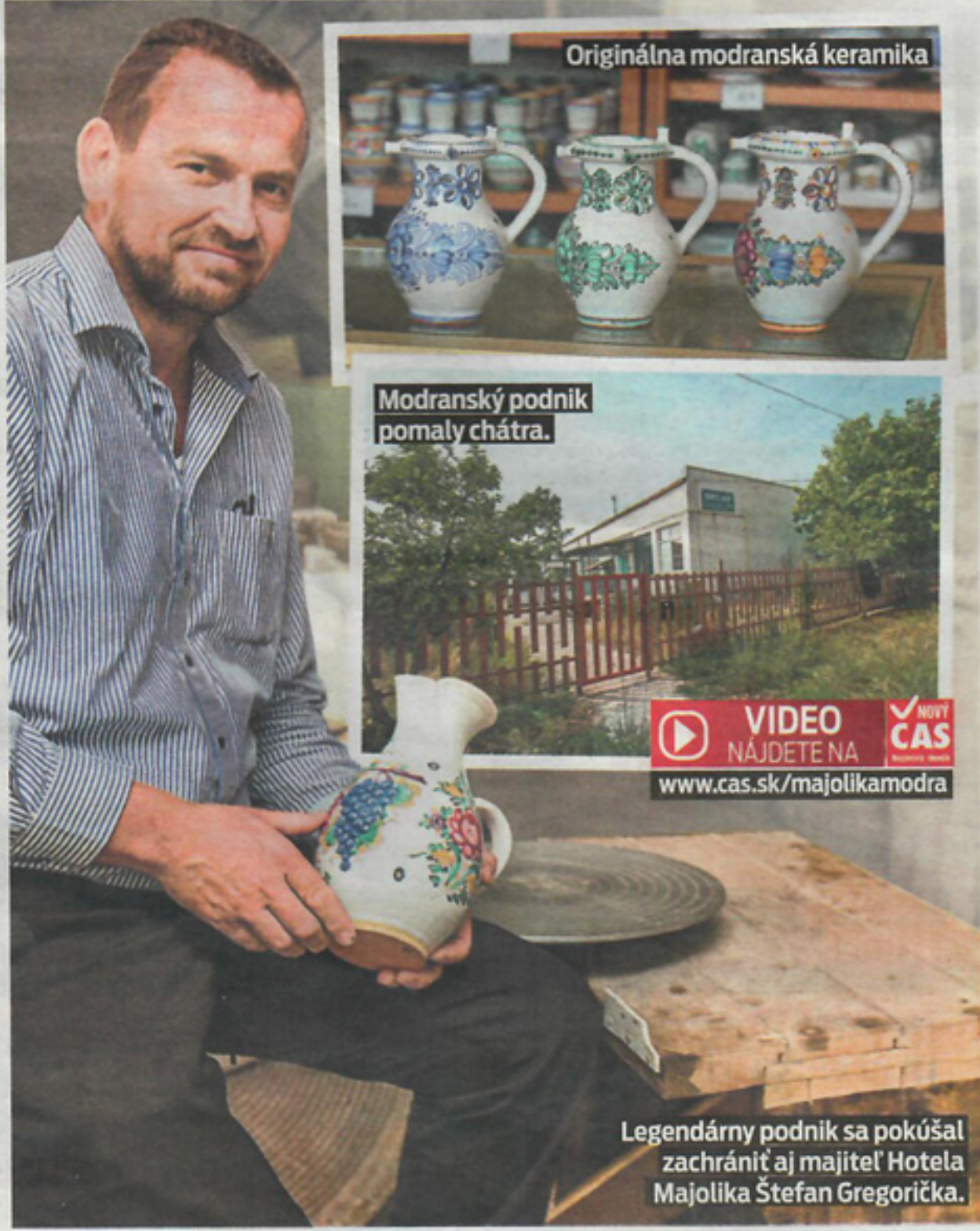
Originálna modranská keramika

liková. Rušňovodič leží na intenzívke a jeho život je v ohrození. Vodič kamióna (43) z Kolína vyšiel akoby zázrakom z vraku bez vážnejších zranení, jeho spolujazdkyňa museli vrtuľníkom previezť do nemocnice na Kramároch. „Počas letu sa jej stav začal zhoršovať, preto bolo potrebné, aby ju lekárka leteckých záchranárov napojila na umelú pľúcnu ventiláciu. Po prilete na Kramáre ju v nezmenenom stave odovzdali lekárom oddelenia anestéziológie a intenzívnej medicíny,“ povedala hovorkyňa leteckých záchranárov Zuzana Hopjaková.